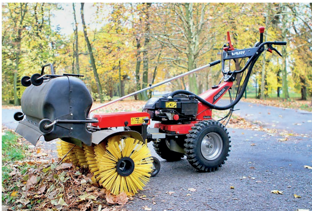
Multifunkční stroj Vari RAPTOR

V roce 2018 byly zrenovovány odbornou firmou umělé povrchy kurtů, atletické dráhy a basketbalového hřiště za budovou školy. Tato regenerace povrchů proběhla poprvé po dlouhých patnácti letech používání. Při regeneraci došlo k odplevelení, uvalcování a prosetí povrchu křemičitým pískem. Abychom zlepšili údržbu umělých povrchů sportovišť, pořídili jsme v uplynulém roce multifunkční stroj Vari RAPTOR. Tento stroj lze využít celoročně, jelikož je možné jej přestavět z mulčovače na zametací kartáč se sběrným košem. Využití tento stroj najde i v zimním období, protože před kartáč lze nasadit shrnovací radlici pro úklid větší vrstvy sněhu. Mulčovač využijeme na kosení trávy v okolí šaten, kurtů a hřišť. Zametací kartáč se zase využije k vymetení mechu a usazenin z umělé trávy. Stroj je také možné využít k údržbě ploch a chodníků na katastru celé obce. Na pořízení stroje se nám podařilo získat dotaci z Olomouckého kraje ve výši 50 %. A tak obec za stroj zaplatila ze svého rozpočtu 44 tisíc korun.