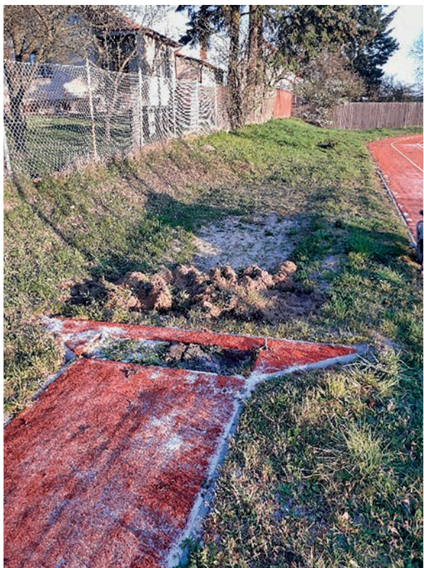
Doskočiště před opravou

kteří lze využít několika způsoby, dopadne vlivem špatné nebo spíše žádné údržby takhle. A tak se doskočiště zbavilo plevelů a vyrobilo se nové dřevěné, odrazové břevno, které by v našich podmínkách mělo vzhledem k využitelnosti sportoviště dostačovat. Rozdíl můžete porovnat na přiložené fotografii níže. Doufám, že takto opravené sportoviště bude mít využití i pro aktivity školy, jak ve výuce, tak i mimo ni.