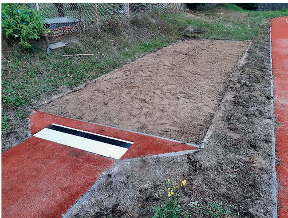
Doskočiště po opravě